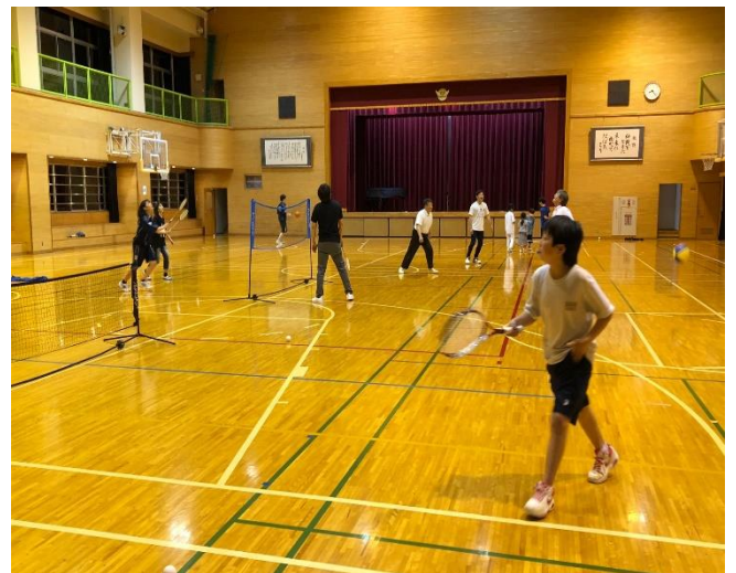
（寄付金で購入させて頂いたテニスとバトミントンをしている子どもたち）

子どもたちの中には、学校に行けてない子たちも、この居場所には来ている。ここに来る以外は、家はずっといる。学校に行かれなくなった背景に貧困が起因している。一度行かれなくなると益々行かれない。そして昼夜逆転の生活リズムとなりネガティブ思考全開。そんな子どもたちが元気になる様、身体を動かしたらどうだろうと体育館を借りた。体育館ではただ走って遊んでいた。ら、子どもたちから、バスケットボールがあればいいな…バトミントンがあればいいな…野球にテニスに…だけどスポーツ用品を購入できる財源がなかった。そんな中、水戸証券株式会社様からスポーツ用品を購入する寄付金を頂きました！